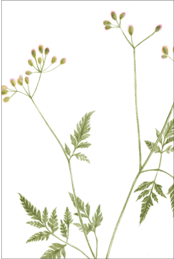
窃衣：伞形科窃衣属一年生或多年生草本植物， 又名破子草、大叶山胡萝卜等。