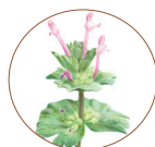
宝 盖 草 ／ 130