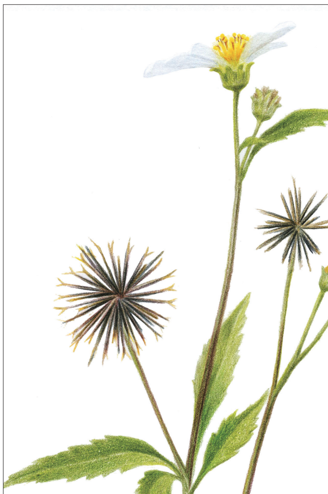
鬼针草：菊科鬼针草属一年生草本植物， 又名婆婆针、粘人草等。