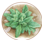
蛤 蟆 草 ／ 106