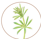
拉 拉 藤 ／ 120